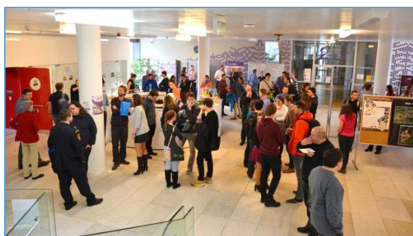
Informace a foto: Katedra geoinformatiky UP